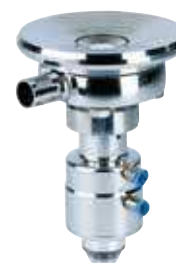
Vanne de fond de cuve