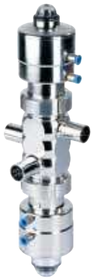
Bloc de vannes