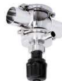
Vanne de prise d'échantillons