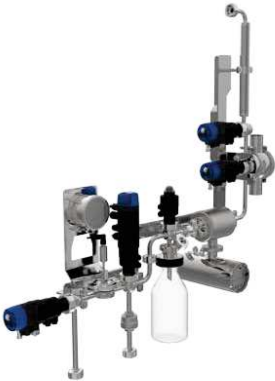
Système de prise d'échantillons VESTA®

Outre ses composants, GEA propose des solutions standard et personnalisées pour différents secteurs et applications.